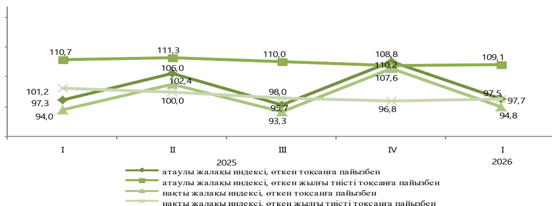
Қазақстан Республикасындағы жалақы