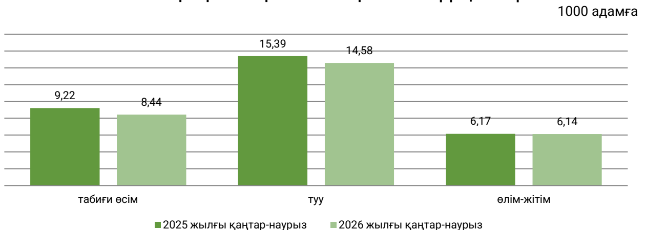
Халықтың табиғи қозғалысының жалпы коэффициенттері