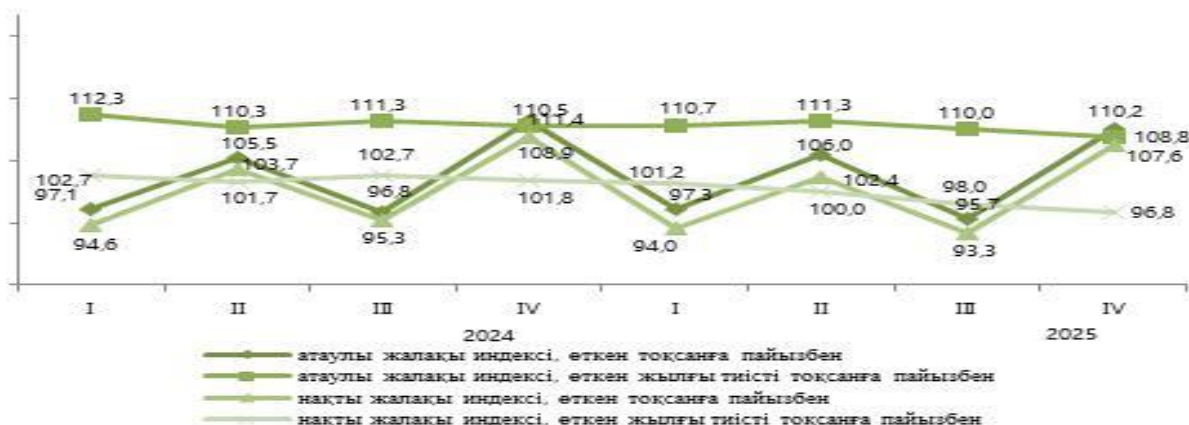
Қазақстан Республикасындағы жалақы