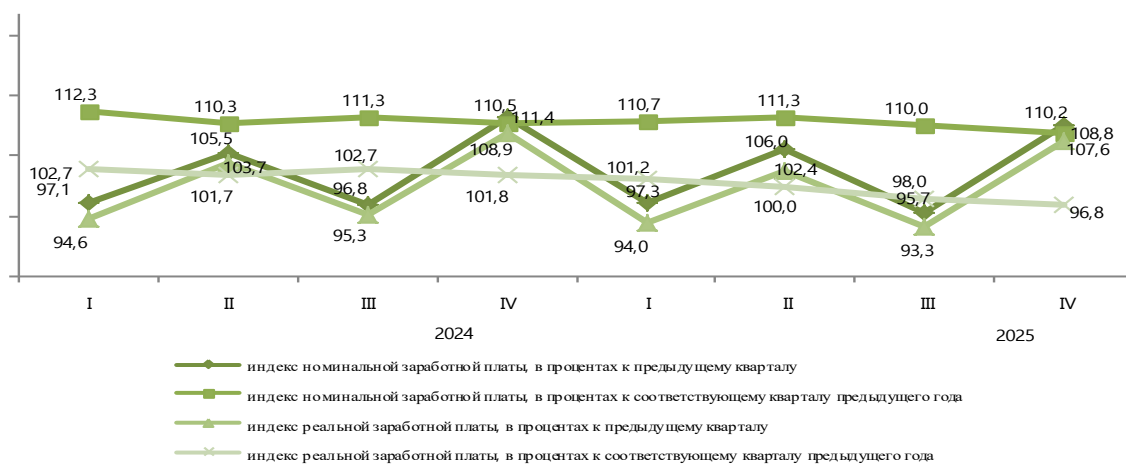
Индекс номинальной и реальной заработной платы по кварталам в Республике Казахстан

По сравнению с предыдущим кварталом среднемесячная заработная плата увеличилось на 10,2%, индекс реальной заработной платы составил 107,6%.