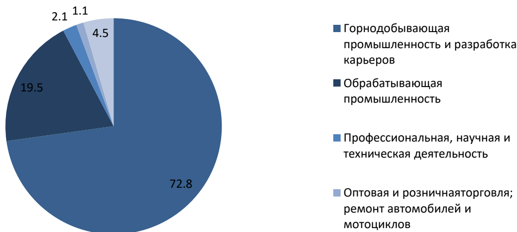
Доля экологических налогов по видам экономической деятельности в 2024г