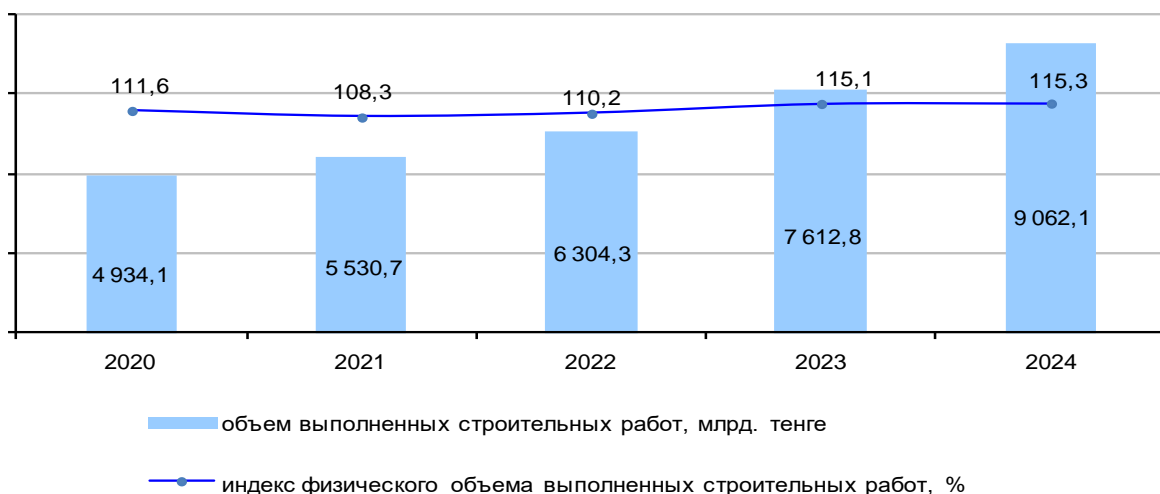
Объем строительных работ в Республике Казахстан

От общего объема строительных работ по республике выполнено частными строительными организациями – 87,3%, иностранными – 12,3% и государственными - 0,4%.