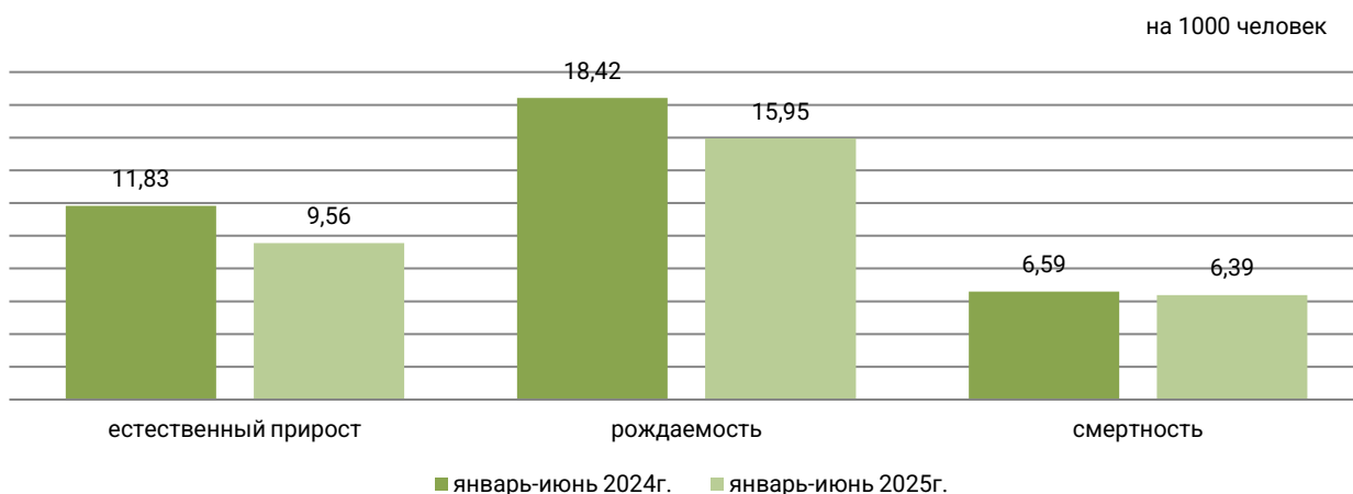
Общие коэффициенты естественного движения населения

Естественное движение населения за январь-июнь 2025г.