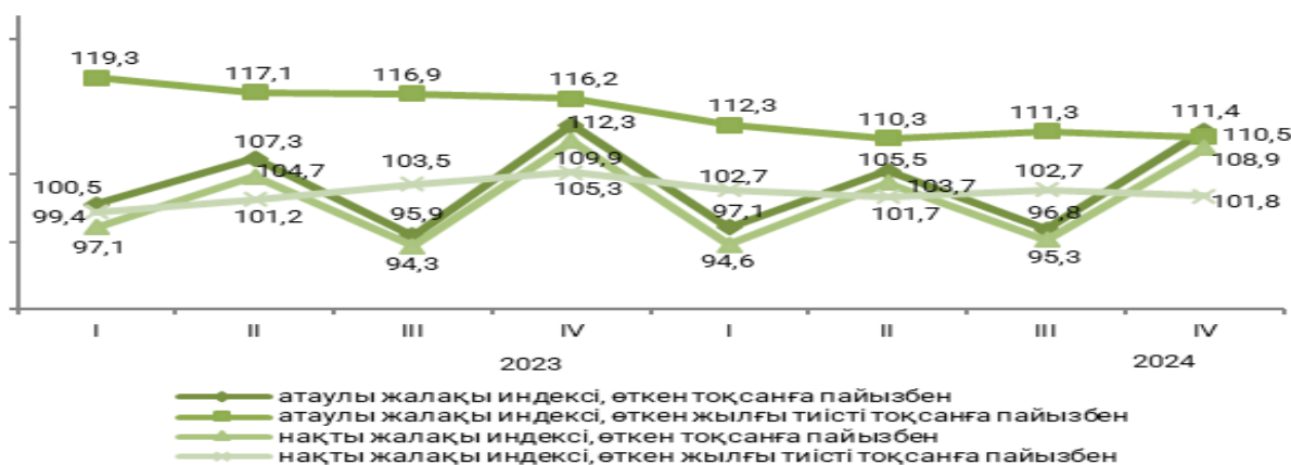
Қазақстан Республикасындағы жалақы