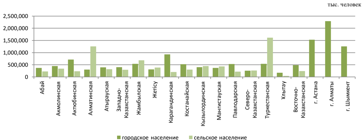
Численность населения по регионам

Уточненная численность населения на начало 2024г.