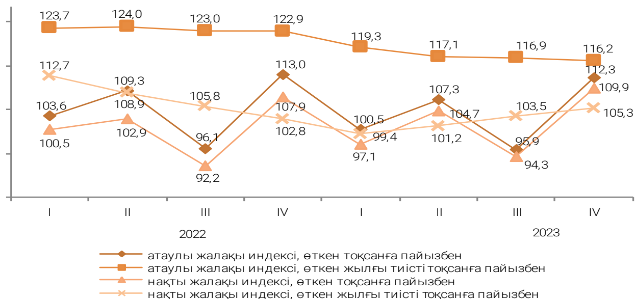
Қазақстан Республикасындағы тоқсандар бойынша атаулы және нақты жалақы индексі